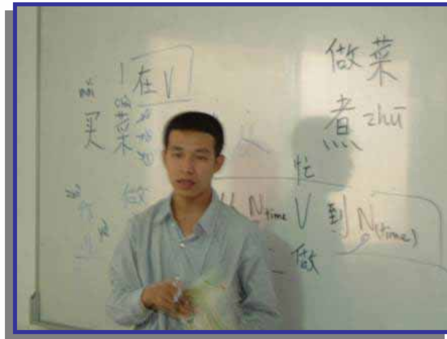
2004, 柬埔寨, 金邊, Formosa Institute